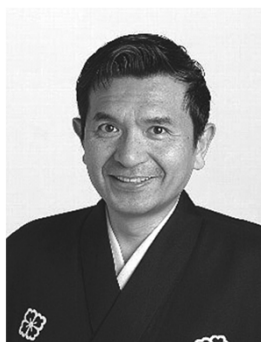
桂小春團治 (かつらこはるだんじ)